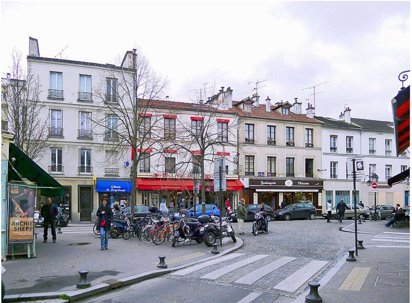
Butte-aux-Cailles (carrefour des rues de la Butte-aux-cailles et des Cinq-diamants) – Paris XIII